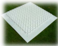
Vue intérieure de la partie inférieure avec sa structure renforcée