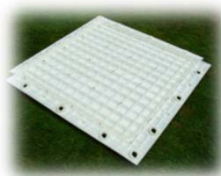
Vue intérieure de la partie supérieure avec sa structure renforcée