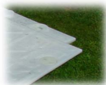
Vue de dessus avec connexion verticale

De par sa facilité de mise en œuvre, sa souplesse d'utilisation et son degré de protection de la surface de jeu, terratrak plus® , est bien supérieur à tout autre produit sur le marché actuellement.