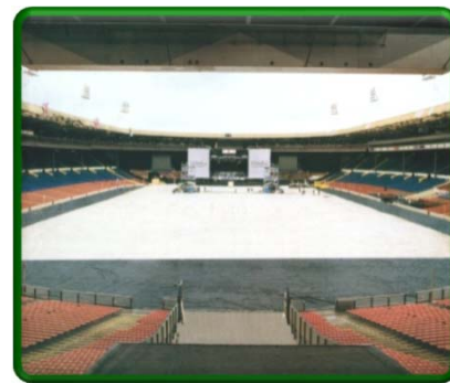
Wembley 1991 prêt pour Rod Stewart

Développé à l'origine, en 1991, avec le Stade de Wembley, l'un des stades précurseur en matière d'évènements non-sportifs, terrapias® est utilisé internationalement désormais par les stades et arénas qui souhaitent accueillir des évènements vraiment multi-évènementiels comme des concerts, salons, soirées, remises de prix et cérémonies religieuses, tout en protégeant efficacement leur pelouse.