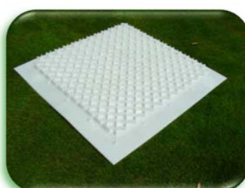
Внутри нижней панели