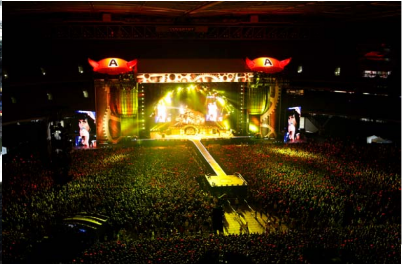
Стадион Этихад, г. Мельбурн, Австралия: terrtrak plus® и Terraplas имеют готовое решение как для концертных, так и официальных мероприятий.