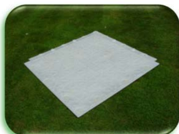
Верхняя часть плитки в сборе

По лёгкости использования, гибкости и степени защиты поверхности травяного газона, terratrik plus® превосходит все остальные продукты на рынке.