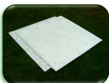
Нижняя часть плитки в сборе