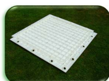
Внутри верхней панели