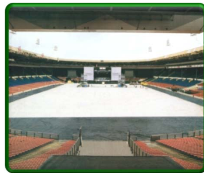
Уэмбли, 1991 г., готов к приёму Рода Стюарта

Первоначально разработанный в 1991 году в ходе консультаций со Стадионом Уэмбли, одной из самых оживлённых мировых концертных площадок, terrapias® сейчас используется во всём мире стадионами/аренами, желающими сделать свои площадки действительно многофункциональными, защитив свои газоны на таких мероприятиях, как концерты, выставки, торжественные ужины, выпускные вечера, политические мероприятия и религиозные церемонии.