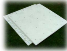
Нижняя часть плитки в сборе