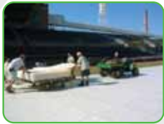
Durham Bulls Carolina del Norte