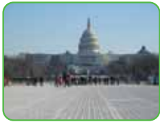
National Mall Washington