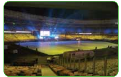
Estadio NSC Olimpiyskiy, Kiev, Ukraine