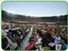
Dinamo Arena Tbilisi