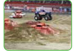
BC Place Vancouver