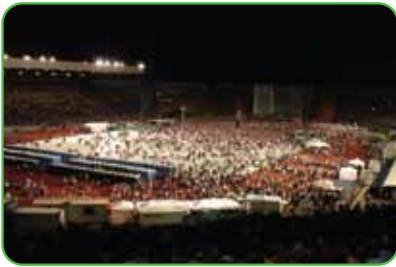
Estadio ANZ, Brisbane, Australia