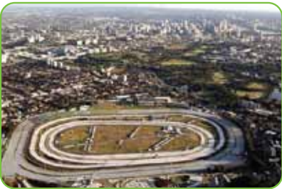
Randwick Racecourse, Sydney, Australia