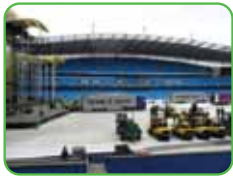
Estadio Etihad Manchester

TERRAPLAS OFRECE LA SOLUCIÓN DEFINITIVA , CUALQUIERA SEA EL EVENTO...