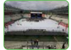
Stade des Alpes Grenoble