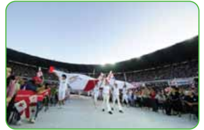
Dinamo Arena, Tbilisi, Georgia