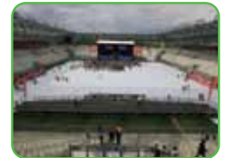
Stade des Alpes Grenoble