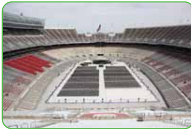
Ohio State University, USA