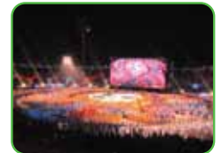
Estadio Sultan Qaboos Oman