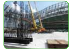
Estadio Aviva Dublin