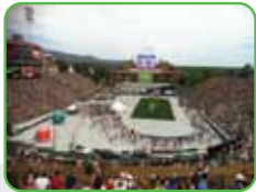
Folsom Field Colorado