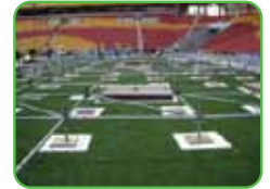
Estadio ANZ Brisbane