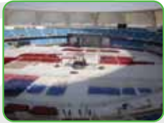
Dubai Sports City