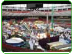
BC Place Vancouver