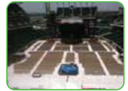
Lincoln Financial Field Filadelfia