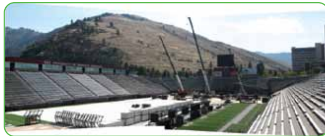
University of Montana, USA