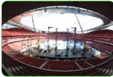
Estadio Emirates, London, UK