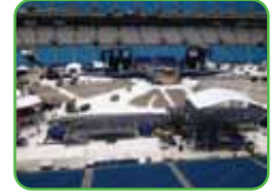
Estadio Bank of America Charlotte