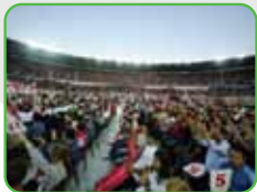
Dinamo Arena Tbilisi