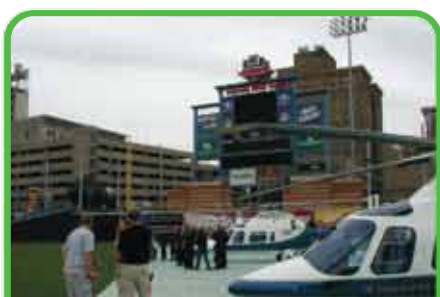
Plate-forme pour hélicoptères