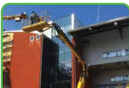
Entretien du stade