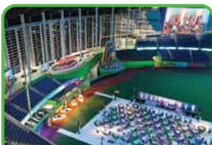
Lancement de produits