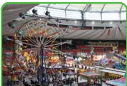
Foires et fêtes foraines