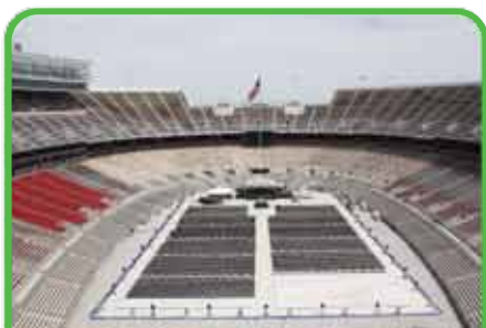
Remise de diplômes