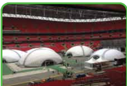
Tournois de Poker ou de jeux d'arcades