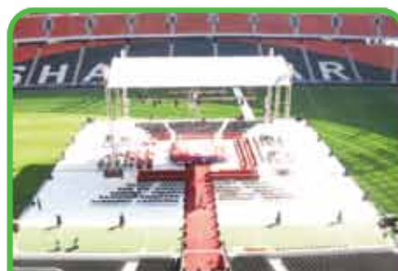
Matches de Boxe et Catch