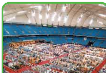
Zones de commerces éphémères