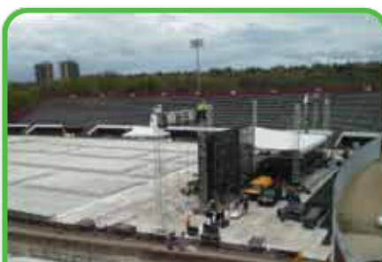
Remises de prix/récompenses – cérémonies d'ouverture et de clôture