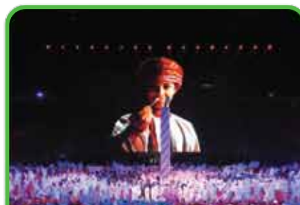
Anniversaires et autres célébrations