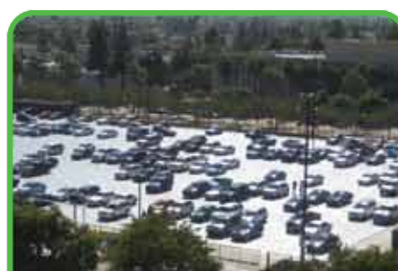
Parking supplémentaires et chemin d'accès temporaires