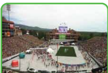
Arrivée et départ de courses