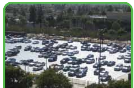
Áreas de Estacionamiento adicional