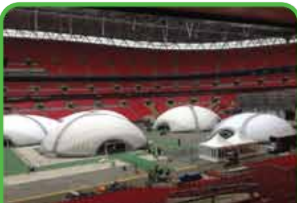
Torneos de Póquer u otros juegos