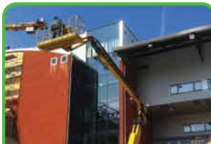
Mantenimiento del lugar