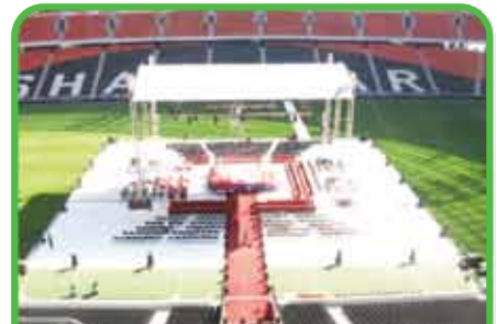
Pelea de Boxeo/Lucha Libre