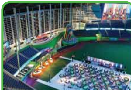
Lanzamientos de Productos