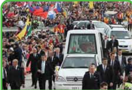
Reuniones religiosas, incluidas, Visitas Papales