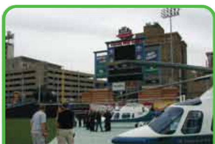
Plate-forme pour hélicoptères