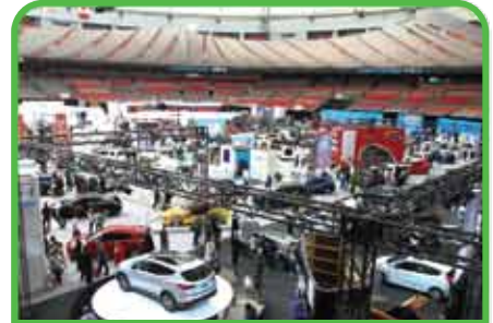
Exposiciones de automóviles casas rodantes