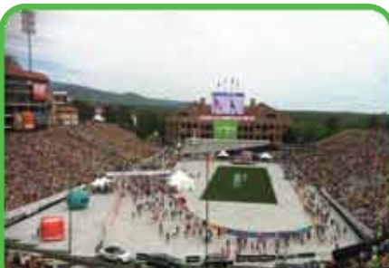
Áreas de Largada y Llegada de Carrera