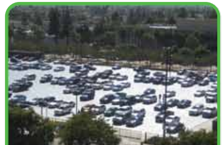
Áreas de Estacionamiento adicional