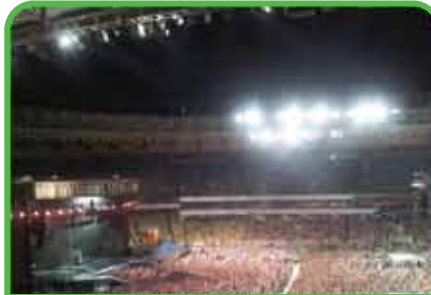
Conciertos de alto perfil