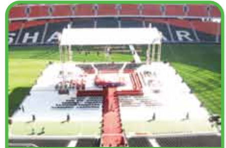
Pelea de Boxeo/Lucha Libre