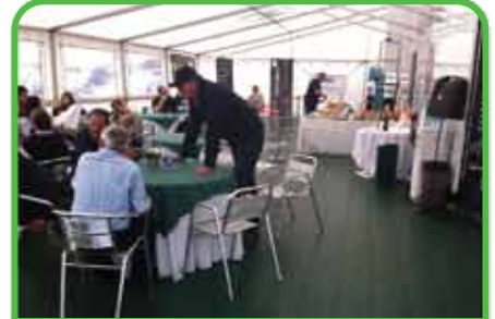
Áreas de Recepción