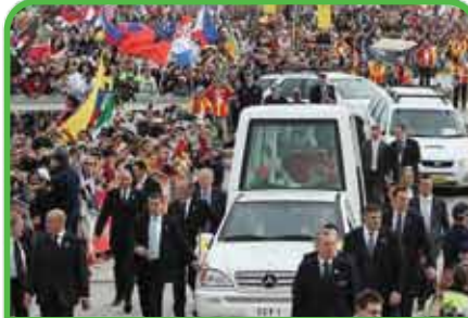
Reuniones religiosas, incluidas, Visitas Papales