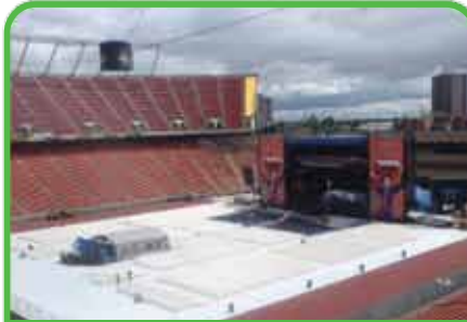
Cobertura parcial para conciertos pequeños