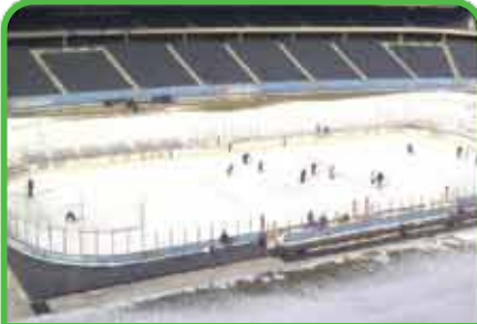
Pistas de Hielo temporarias