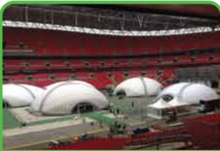
Torneos de Póquer u otros juegos