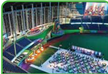
Lanzamientos de Productos