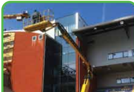
Mantenimiento del lugar