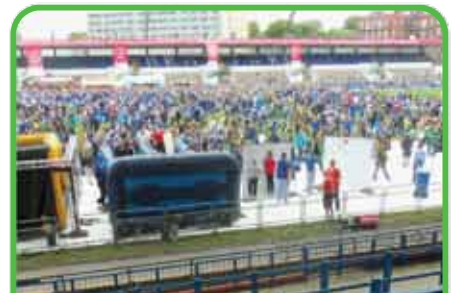
Áreas de concesión