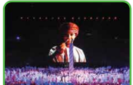
Celebraciones trascendentales de aniversarios