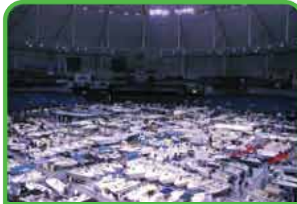
Exposiciones de embarcaciones