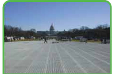
Áreas abiertas para cualquier evento