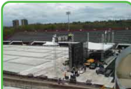
Presentaciones de Premios